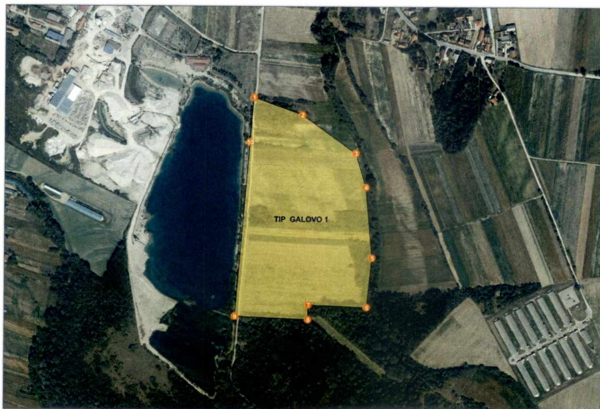
Grafički prikaz traženog istražnog prostora građevnog pijeska i šljunka "Galovo 1":